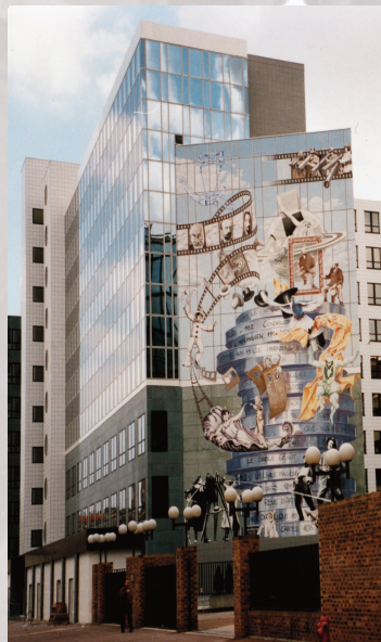
Montreuil - Le Méliès