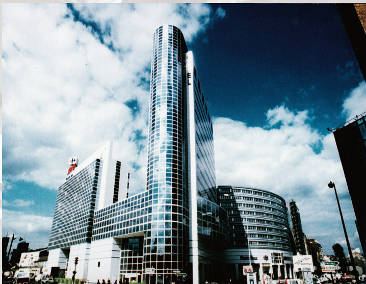
Montreuil - La grande porte